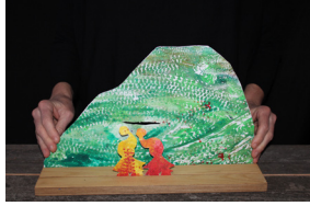
Gestaltung © Gabi Scherzer

FIGUREN DURCH DEN SCHLITZ WIEDER NACH VORNE SCHIEBEN